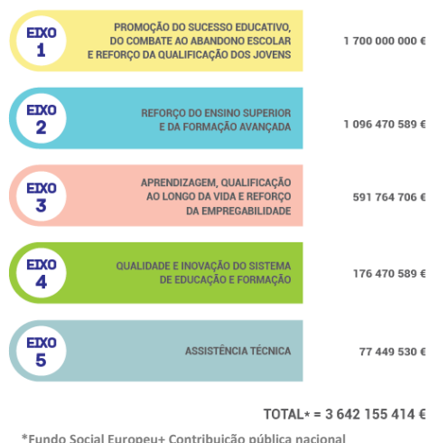
FIGURA 1 ESTRUTURA E DOTAÇÕES DO PO CH

O Eixo 1 concentra a maior fatia dos recursos totais do PO - 47% do total – e apoia a qualificação dos jovens, por via sobretudo dos cursos profissionais do ensino secundário e de